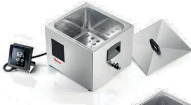
SOFTCOOKER SR 2/3 WI-FOOD