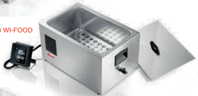
SOFTCOOKER SR 1/1 WI-FOOD