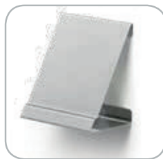
Pratica staffa per display The practical bracket for the display box