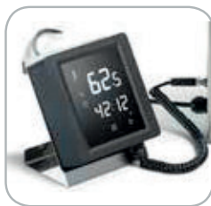
Comandi touch Touch controls