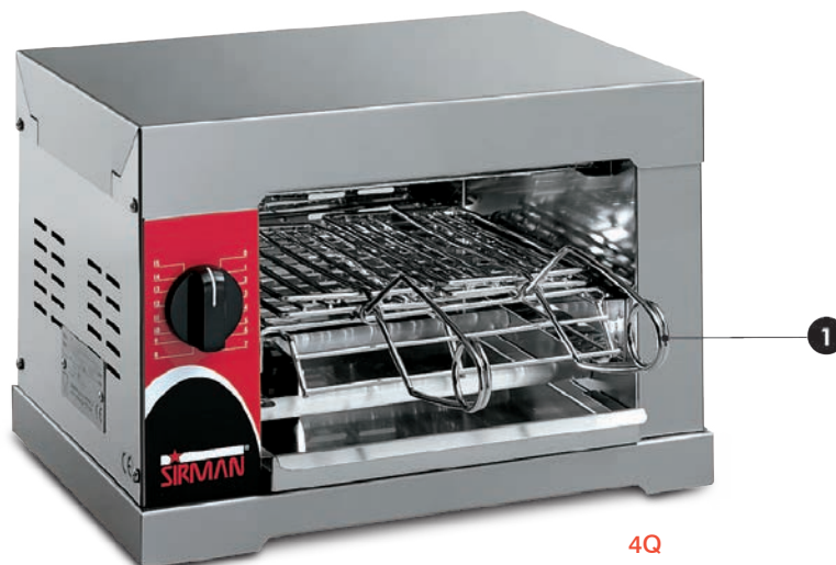
4Q 1. pinze di serie 1. Standard tongs