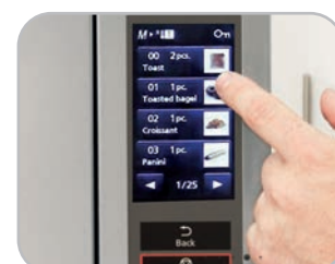
Comandi digitali Digital controls