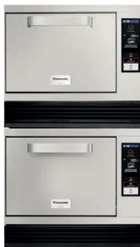
Forni sovrapponibili Stackable ovens